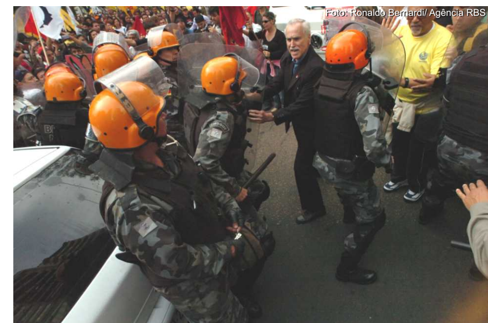
Marcha dos Sem: bombas e tiros de borracha contra movimentos sociais

Entre as violências, destacam-se a repressão aos comerciários das Lojas Colombo, em Farroupilha, em setembro do ano passado; a violenta repressão ao protesto dos movimentos sociais contra a corrupção no governo Yeda e contra a alta nos preços dos alimentos, em junho de 2008; as prisões e o uso de violência desmedida contra manifestações do CPERS;