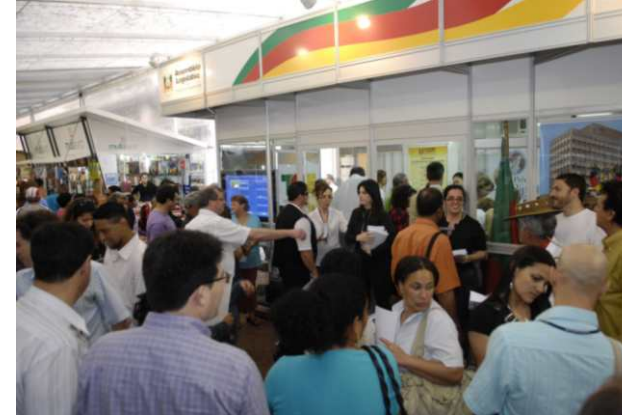
Estande da ALERS lotou para lançamentos