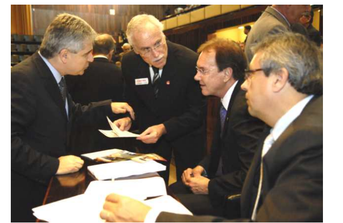
Lei que já beneficia Porto Alegre estende-se ao RS