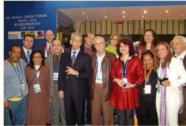
Carrion conheceu experiências mundiais na habitação