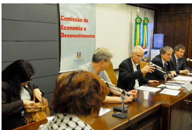
Com nova linha, Ceitec operará com mais segurança