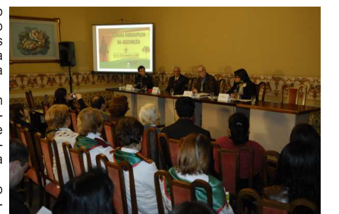
Apresentações, debates e homenagens marcaram semana

No Plenário, uma Sessão Solene marcou as comemorações.