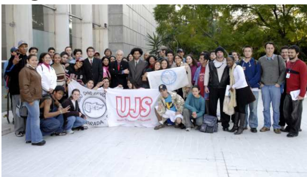
Estudantes comemoraram homenagem na ALERS

Hoje, a UBES representa 50 milhões de estudantes dos ensinos fundamental, médio, técnico, profissionalizante e pré-vestibular do Brasil.