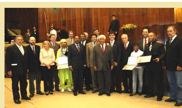
Plenário homenageou personalidades da negritude