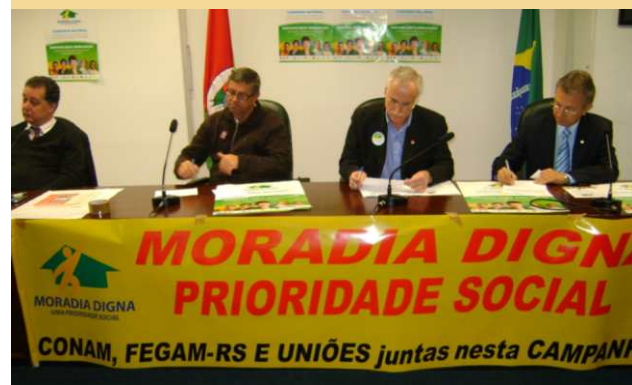
Abaixo-assinado pela moradia passa pelo RS